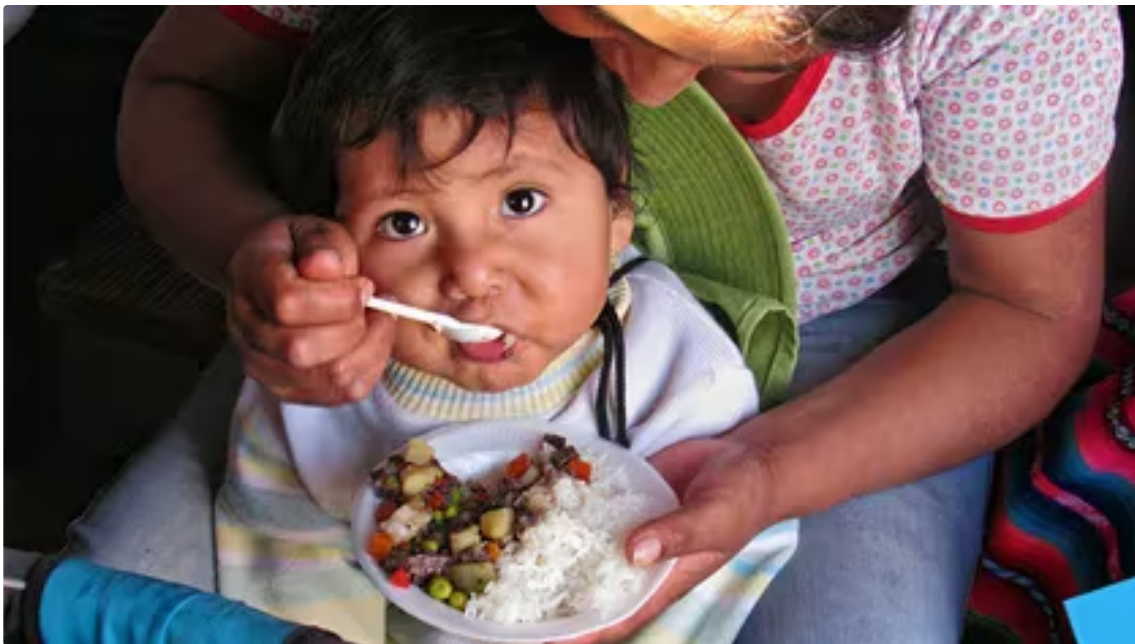
Algunas comunidades de Oaxaca y Tamaulipas tienen más portadores de la anemia Fanconi.

Una pieza clave es la observación de las mutaciones de los genes FANC , encargados de contribuir en la reparación del ADN . La enfermedad se deriva de estas modificaciones, y conduce a una producción deficiente de células hematopoyéticas y a una reducción en la diversidad de células sanguíneas, lo cual incrementa el riesgo de infecciones y fatiga. La predisposición al desarrollo de ciertos tipos de cáncer, en particular la leucemia mieloide aguda y tumores sólidos, también fue identificada como un peligro destacado para los pacientes.