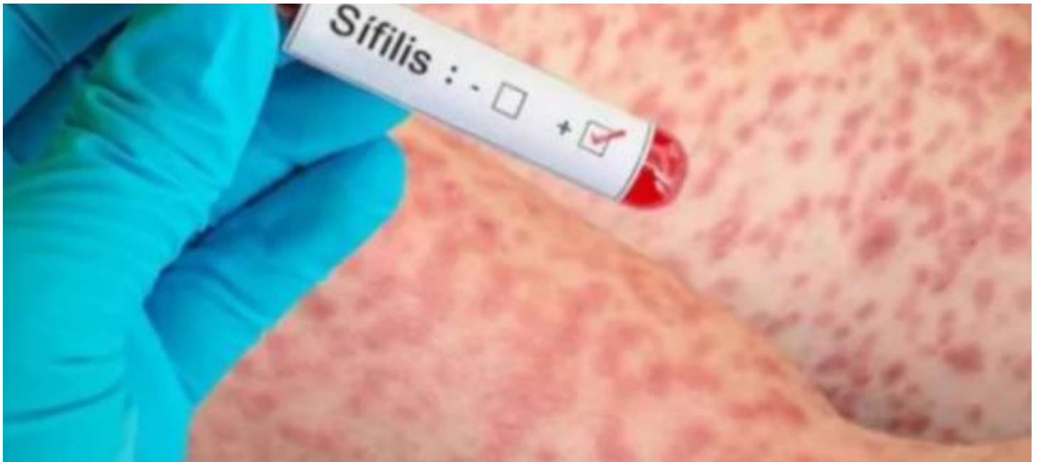
Prueba de sífilis Especial

La sífilis secundaria ocurre varias semanas o meses después del cuadro primario. Se trata de una enfermedad sistémica con malestar general, cansancio, fiebre, adenomegalias y la aparición de un rash con múltiples pápulas rojas llamadas clavos sífilíticos que pueden aparecer en cualquier parte del cuerpo. El cuadro dura semanas o meses y, como la sífilis primaria, sin tratamiento desaparece solo.