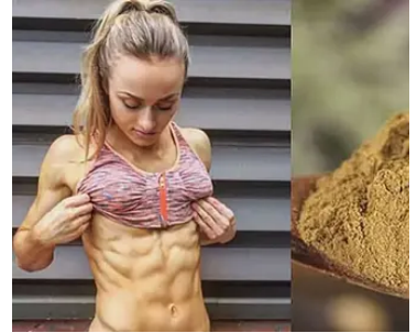
Sirt2slim Una cucharada en ayunas puede quemar grasa en 7 días