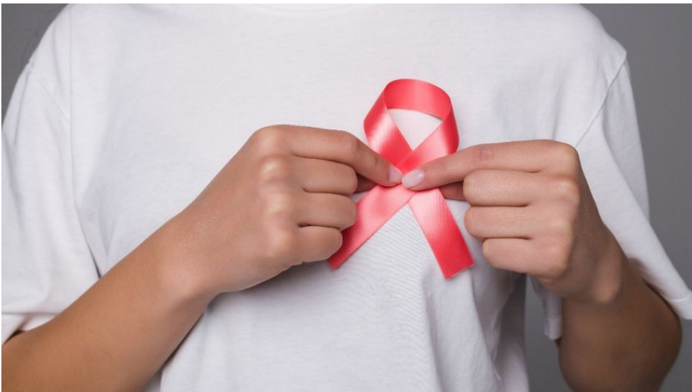
Créditos: Freepik / Foto ilustrativa