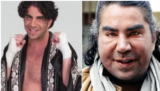
Ballercap Los famosos que enamoraron a los fans durante los 90 ahora