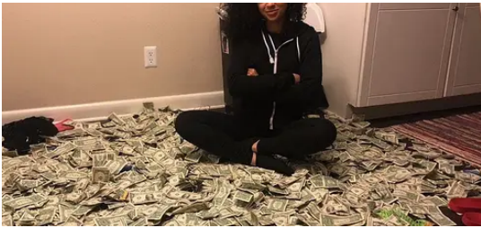
Oil Trade De simple camarera a una de las mujeres más ricas de Ciudad de México