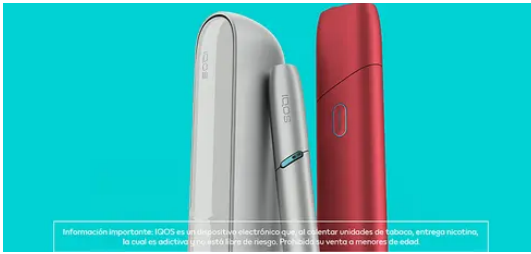
IQOS IQOS calienta, no quema como los cigarrillos