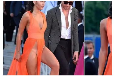
Ballercap Los bloopers de la alfombra roja que captados en la foto