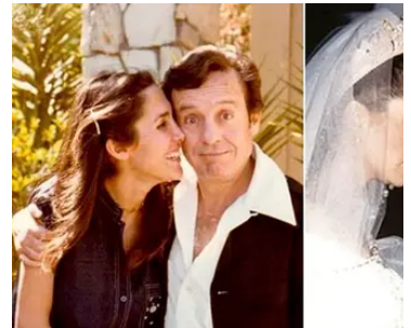
Ballercap 40+ triángulos amorosos entre famosos dignos de recordar