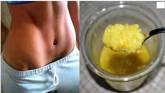
Lipoxin Niña de Ciudad de México causó furor con receta de perder 13 kg en 23 días