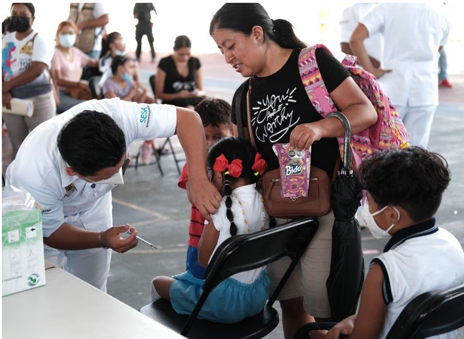
Una niña recibe el refuerzo de la vacuna contra la covid-19, en un colegio en Cancún.

En menos de un mes empieza la vacunación de refuerzo para covid-19 en México y todavía no está claro para quién va a ser ni con qué vacunas. Mientras Estados Unidos acaba de aprobar el uso de inmunización actualizada a las últimas mutaciones del virus SAR-CoV-2, en México los detalles todavía son confusos. El secretario de Salud , Jorge Alcocer, dijo la pasada semana que se iban a usar Abdala y Sputnik y que iban a ir destinadas a 24,5 millones de personas, que representan cuatro grupos prioritarios de población de riesgo. Sin embargo, ahora el presidente Andrés Manuel López Obrador ha abierto la puerta a que sean para toda la población y el subsecretario Hugo López-Gatell, que fue la cara visible en la lucha contra la pandemia, ha señalado que las farmacéuticas privadas que quieran introducir vacunas deben pedir un permiso a Cofepris, la agencia de regulación sanitaria.