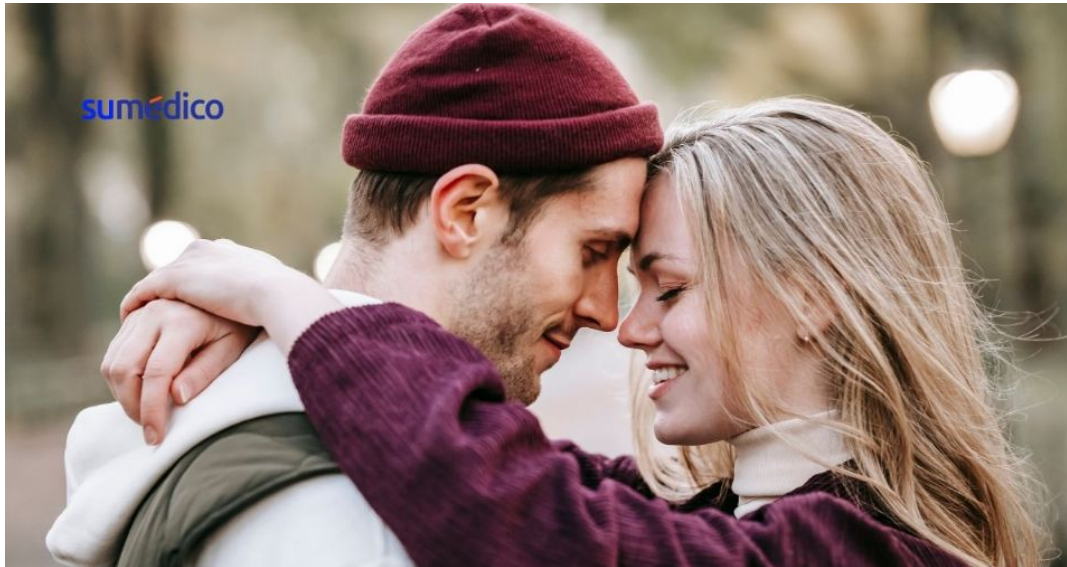
El amor y el enamoramiento se confunden fácilmente, pero no son lo mismo.