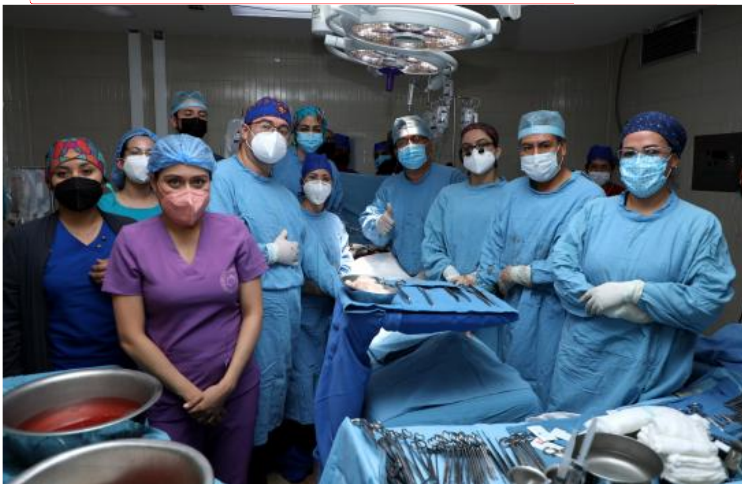
Médicos especialistas del IMSS, salvan cientos de vidas gracias a la donación, procuración y trasplante de órganos en todo el país

El examen es particularmente difícil porque se basa en una serie de enunciados para los que la respuesta para cada enunciado solo puede ser V, de verdadero, F de falso. Un enunciado puede ser: “la anemia es una característica distintiva de la insuficiencia renal crónica”, es falso, pero puede resultar confuso, porque la anemia sí es una característica de su fase crónica. Los textos de medicina dicen lo que se puede ver o encontrar en una enfermedad, pero obviamente no dicen lo que no, porque sería interminable. De tal manera que para saber si un enunciado es verdadero o falso, el estudiante debe tener muy firmes los conocimientos.