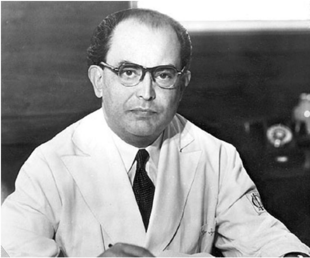
-Guillermo Soberón Acevedo, rector del 3 de enero de 1973 al 2 de enero de 1981.

Egresó de la Escuela Nacional de Medicina de la UNAM y obtuvo el doctorado en fisiología por la Universidad de Wisconsin. Fue director del Instituto de Investigaciones Biomédicas de la UNAM y coordinador de Investigación Científica. Durante su rectorado se crearon las Escuelas Nacionales de Estudios Profesionales y se expandió la infraestructura para la investigación de CU. Fue secretario de Salud durante el gobierno de Miguel de la Madrid.