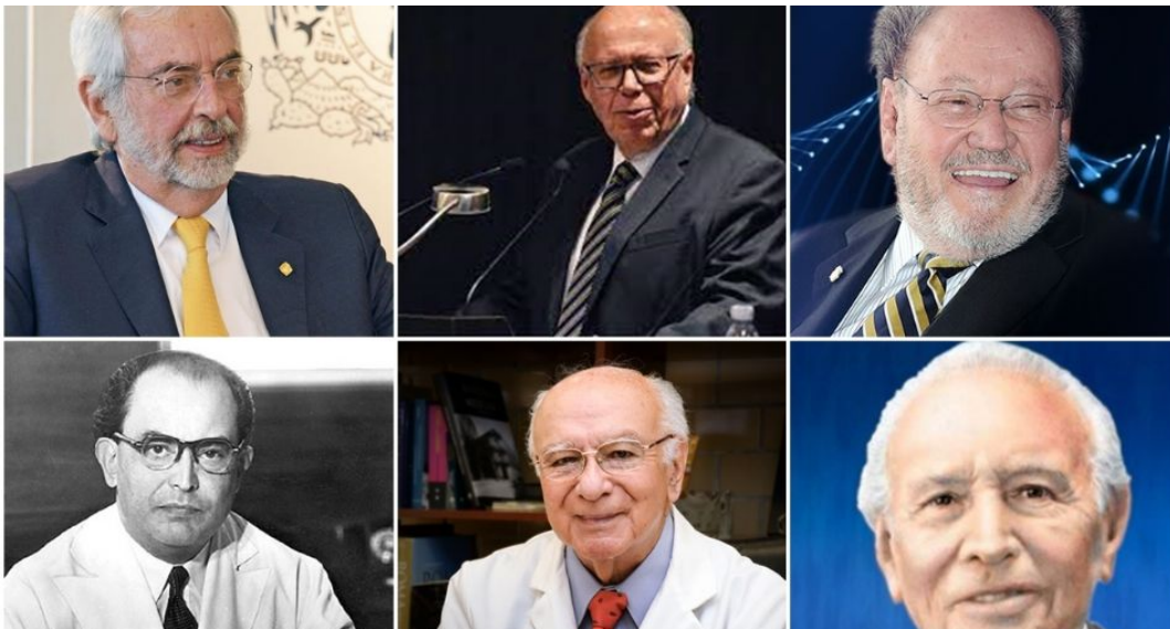
Los rectores de la UNAM salidos de la Facultad de Medicina