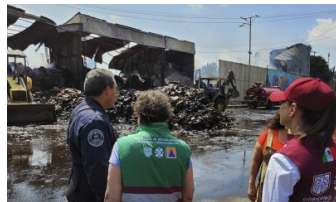
Descarta Sheinbaum extorsión tras incendio en Central de Abasto