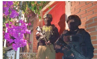
En CDMX, detienen a 7 integrantes de “Machete de la Chapiza”, relacionados al Cártel del Golfo