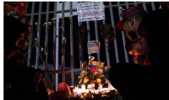
Suman 40 migrantes fallecidos tras incendio en estación INM