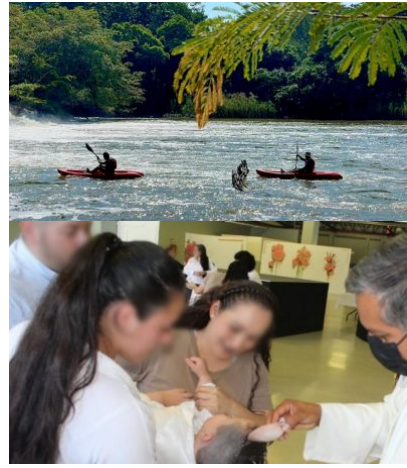
MÉXICO / 21 horas atrás En Semana Santa, se casan y bautizan en 4 CEFERESOS