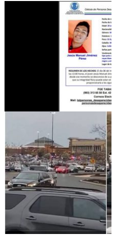
MUNDO / 21 horas atrás Desalojan centro Delaware por tirc