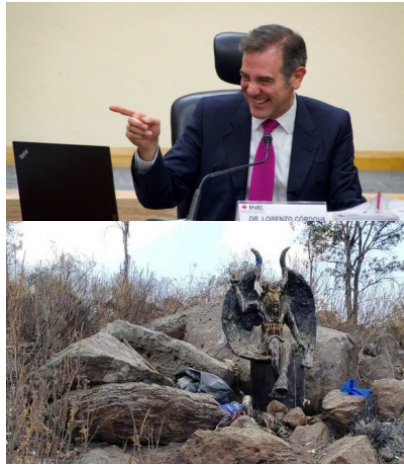
MÉXICO / 6 horas atrás Encuentran altar satánico en Edomex con restos humanos