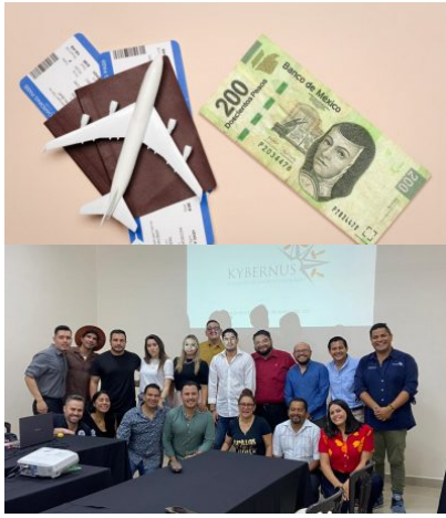
LIDERES EN ACCIÓN / 12 horas atrás Kybernus impulsando a emprendedores