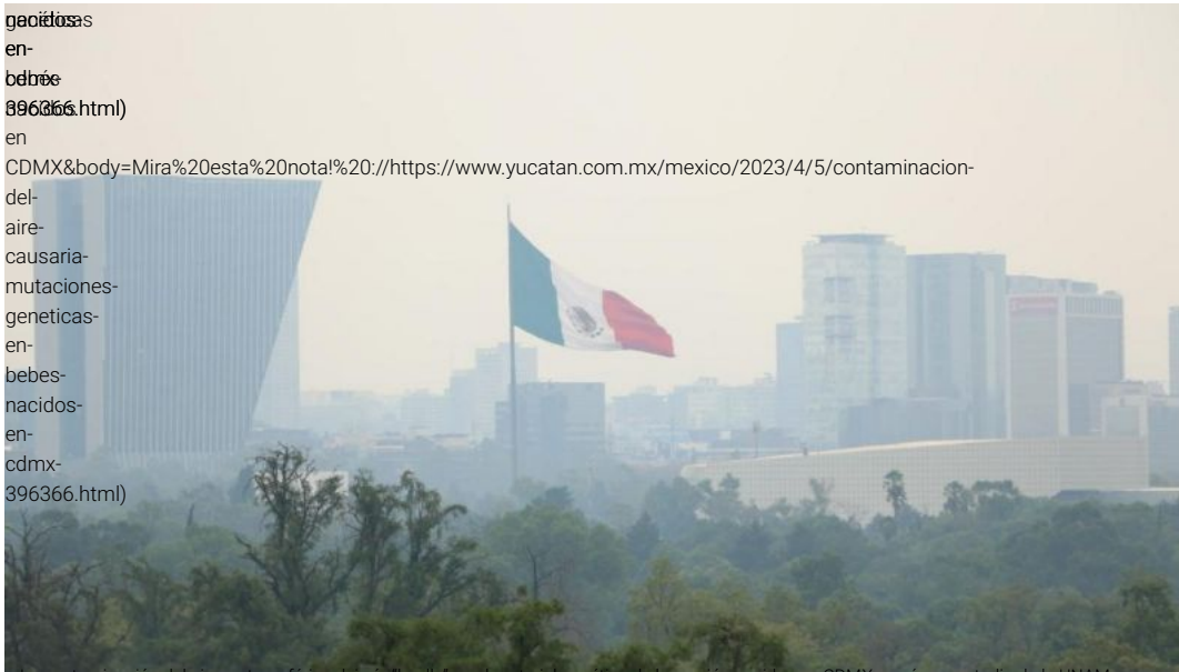
(/La contaminación del aire o atmosférica deja una huella en el material genético de los recién nacidos en CDMX, según un estudio de la UNAM. (/u/fotografias/fotosnoticias/2023/4/3/676689.jpeg)

gacidos en- bdre 396366.html) en CDMX&body=Mira%20esta%20nota%20://https://www.yucatan.com.mx/mexico/2023/4/5/contaminacion- del- aire- causaria- mutaciones- geneticas- en- bebes- nacidos- en- cdmx- 396366.html)