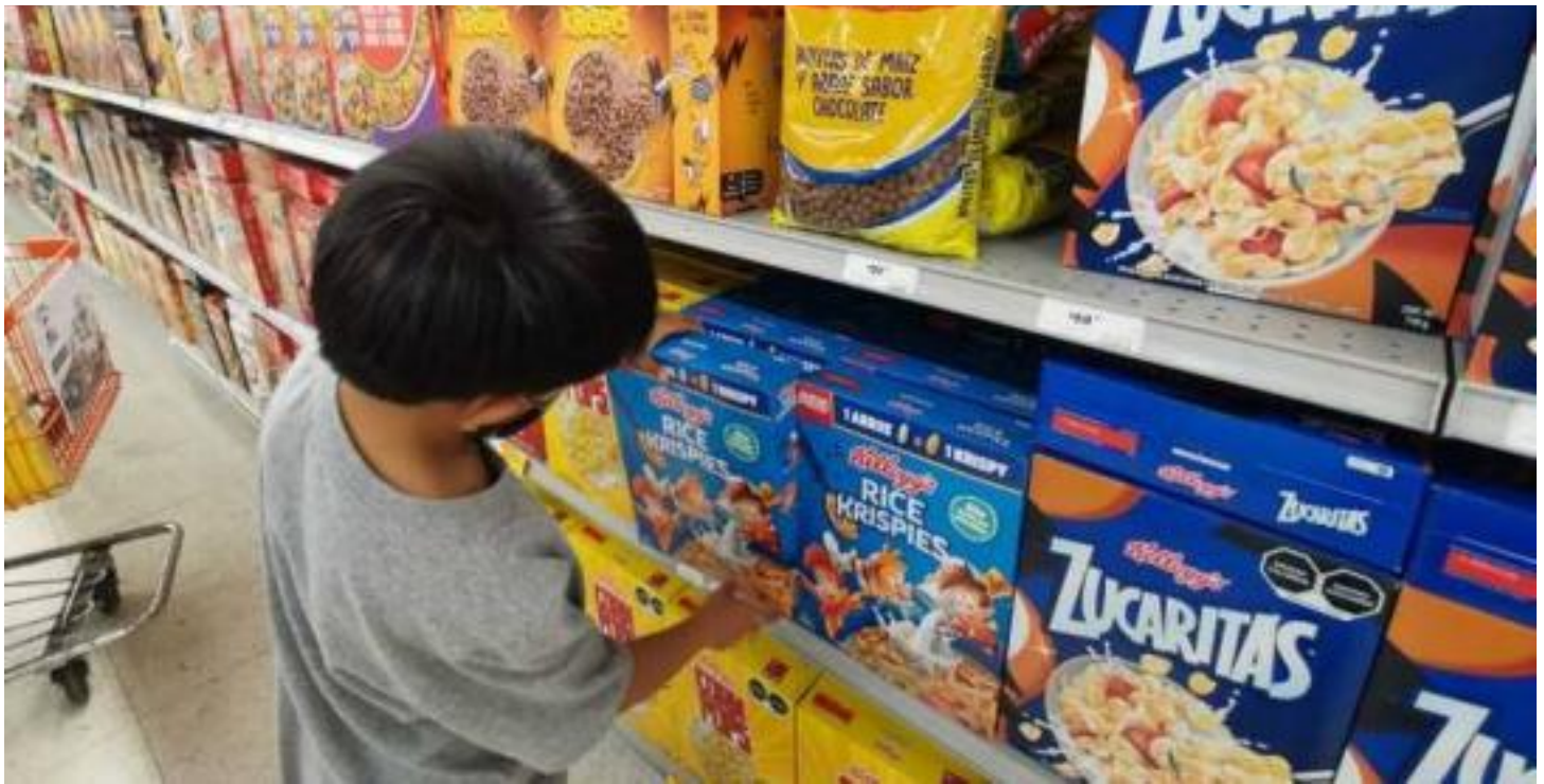
Otras medidas pendientes son la publicidad, regulación en las escuelas e impuesto a estos productos.

Los alimentos estaban diseñados para que entre ambas dietas presentaran las mismas calorías, densidad de energía, macronutrientes, azúcar, sodio y fibras. La diferencia entre las dietas era si las calorías venían de alimentos no procesado o ultra procesados. Los sujetos del estudio fueron instruidos a consumir la cantidad que quisieran. Tenían acceso a tres comidas al día, con 60 minutos para consumir los alimentos y, además, acceso libre durante el día a diversos bocadillos, también ultra procesados o no procesados.