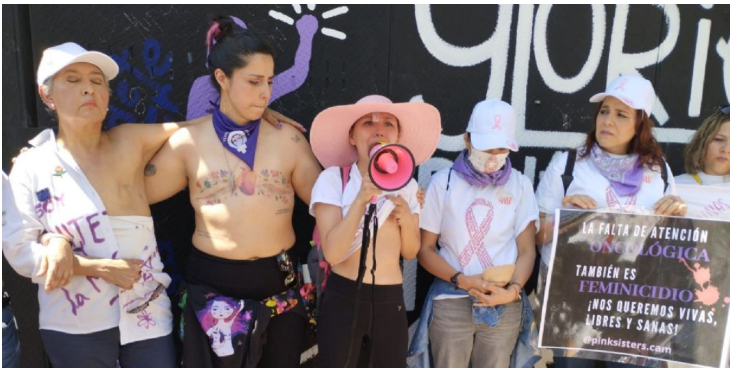
En la lucha del 8M. Pacientes con cáncer de mama que forman parte del colectivo "Jódete Cáncer" se sumaron de manera simbólica a la marcha de este 8 de marzo.