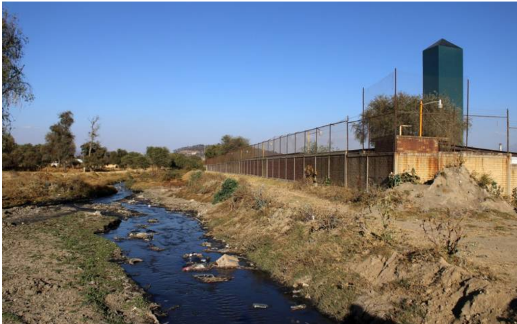
Hay riesgos documentados de salud que afectan a las personas que están cercanas a cuerpos hídricos como el Xochiac.

El Río Xochiac, situado en Huejotzingo, agoniza cada día ante la descarga de varias toneladas de sustancias tóxicas